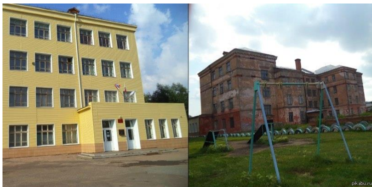
Старое здание школы 1936 года постройки