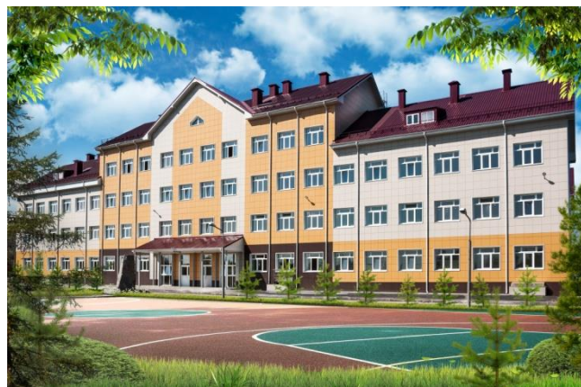
Новое здание школы 2016 года постройки